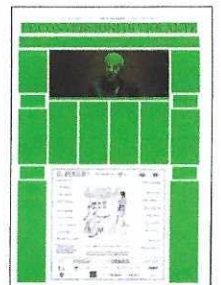
Superficie 67 %