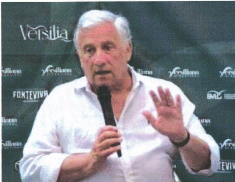
ANTONIO TAJANI ALLA VERSILIANA

Di esempi ve ne sono tanti e l'ultimo in ordine di tempo è la dichiarazione di Antonio Tajani che ha sollecitato di riprendere le privatizzazioni perché lo Stato ha bisogno di far cassa. In un paese ricco come il nostro nessuno avanza qualche idea per riequilibrare le intollerabili diseguaglianze asciugando qualche lacrima e senza far piangere nessuno. Ma di questo ne riparleremo.