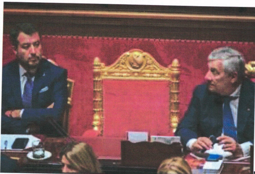
MATTEO SALVINI ANTONIO TAJANI

Il disastro delle privatizzazioni ha dato il destro ai francesi di rilevare anche con società pubbliche grandi eccellenze italiane mentre stranamente i tedeschi hanno fatto la stessa cosa con la Grecia, mentre sono stati assenti negli investimenti in Italia.